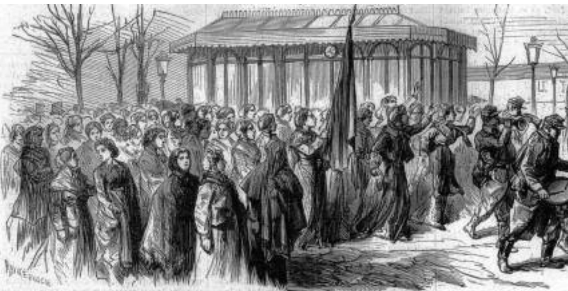
JOURNÉE DU 3 AVRIL. — LA MANIFESTATION DES FEMMES.

rue de Rivoli un cortège de plus de cinq cents femmes se tenant bras dessus bras dessous, agitant leurs mouchoirs au cri de : Vive la République, et se dirigeant sur la place de la Concorde. Tambours et clairons marchaient en tête. On assurait qu'elles allaient à Versailles.