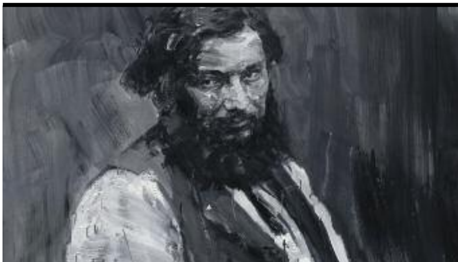
Portrait de Courbet

L'exposition Corps à corps s'est tenue du 12 octobre 2019 au 12 janvier 2020 au Petit Palais. L'Enterrement à Shanghai a été exposé au musée d'Orsay du 1 er octobre 2019 au 12 janvier 2020.