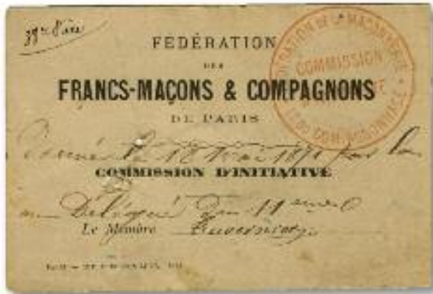
Carte de la Fédération des francs-maçons et compagnons, 1871.