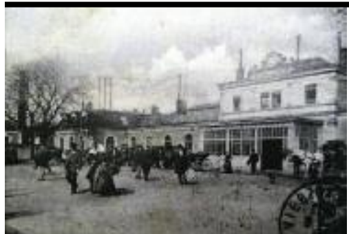
Gare de Vierzon

Quant au Berry, l'effet de l'isolement rural de l'Indre, et celui de l'influence de la Nièvre pour le Cher, expliquent les différences. L'avancée surtout industrielle du Cher, bénéficiant des choix de désenclavement, favorise l'ouverture aux idées républicaines et sociales, perceptibles en 1849. L'Indre rurale, à la population très dispersée dans les campagnes, voit ses deux principales villes prendre une grande importance. Ces situations dissemblables déterminent des degrés de politisation distincts, dépendant étroitement du contexte local.