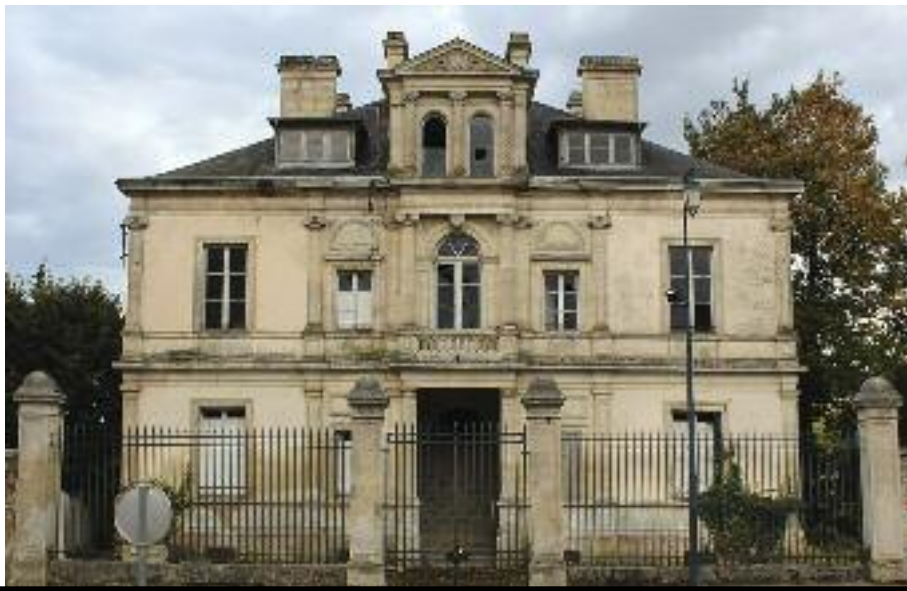
Ancien presbytère de Marmers, construit entre 1852 et 1857