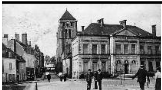
Hôtel de ville de Cosne-sur-Loire

Julien Papp, La République en Touraine et la Commune de Paris, 1870-1873 , Éditions du Petit Pavé, 2015. Histoire du Nivernais et de Nevers de l'Empire à la République, 1866-1879 , Arch. Dép. de la Nièvre, 2008. Enquête parlementaire sur l'insurrection du 18 mars 1871. Rapports , Librairie Germer-Baillièrre, 1872. Armand Le Chevalier, Les Murailles politiques françaises depuis le 18 juillet 1870 jusqu'au 25 mai 1871 , 1874. Conférences itinérantes en Indre : Étude des espaces cantonaux sous la Commune, depuis 2016 . Communication, La Province et la Commune : l'exemple du Berry , 2019. https://1851.fr , site de l'Association 1851. Pour la mémoire des Résistances républicaines .