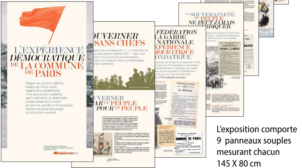
L'exposition comporte 9 panneaux souples mesurant chacun 145 X 80 cm

Un sujet très contemporain, la Commune n'est pas morte !