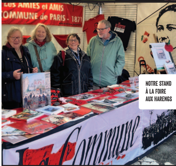
NOTRE STAND À LA FOIRE AUX HARENGS

L e 8 novembre : accueil des participants au voyage annuel venus découvrir le livret de parcours communard dans les rues du centre-ville.